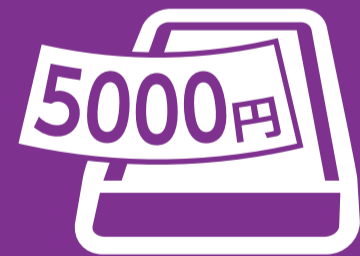
トレーにてお金の受渡