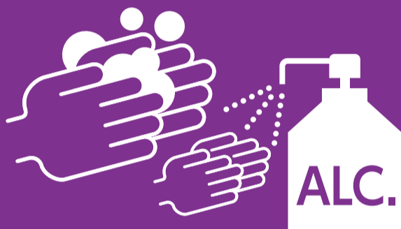
スタッフの手洗い、消毒